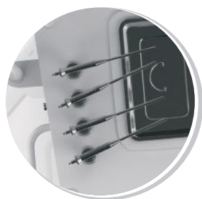
РАСПЫЛИТЕЛИ ЛЕКАРСТВЕННЫХ СРЕДСТВ