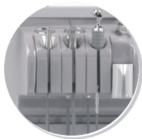
АСПИРАТОР, ПИСТОЛЕТ ДЛЯ ПРОМЫВАНИЯ УХА, РУКОЯТКА РАСПЫЛИТЕЛЕЙ