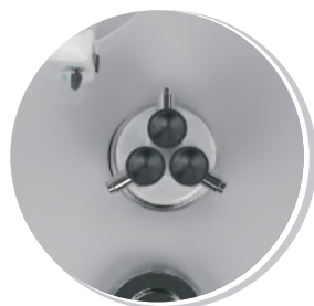
СБРОС ОТХОДОВ И ИСПОЛЬЗОВАННОГО ИНСТРУМЕНТА